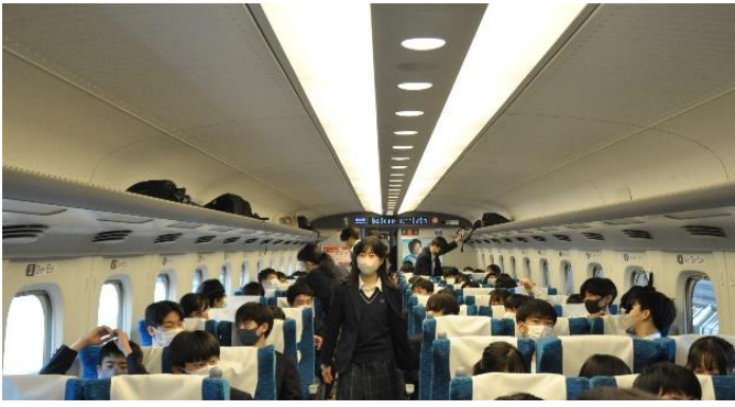
とりあえず自分の座席に座って一息。