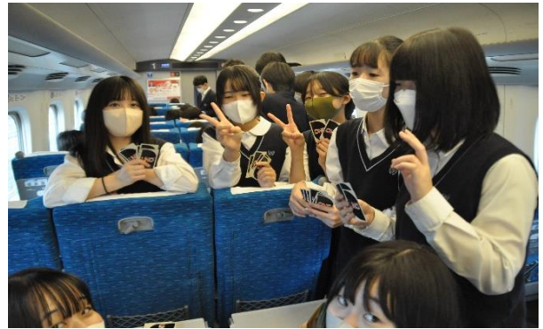
車内ではトランプやUNOなどで楽しみました。

まずは法隆寺でのクラス写真撮影でした。マスクを取って素早く撮影。五重塔をバックにハイチーズ。そのあとは、YSJ(薬師寺)で大人気アトラクションの説法。当日、ご本人がおっしゃっていましたね。