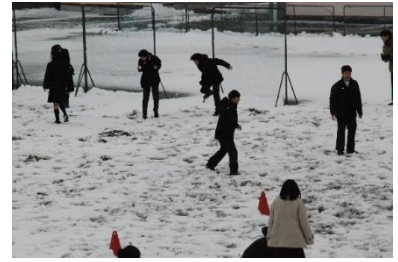
雪合戦して楽しかった6日の昼休み

2月5日は午後から雪が降り、一面の銀世界でした。次の日は、先生、主事さんがたが、朝早くから皆さんが登校するときに困らないように雪かきをしてくださりました。皆さんは、いろいろなかた方に支えられて生活しています。それを忘れないでください。私たちは何でも自分でやっている、誰にも迷惑かけていないと思いがちですが、一人でできることなんて限られています。感謝の気持ちを忘れずにいきたいものですね。