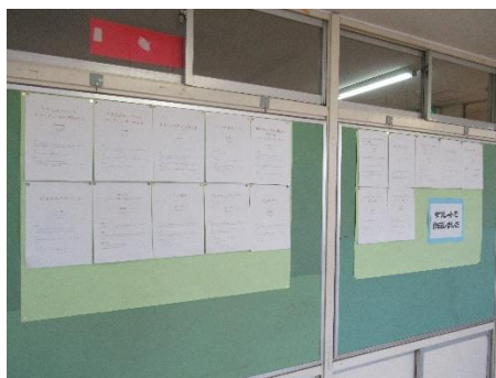
【国語】中学生のことをしてほしい