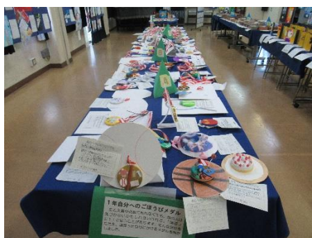
【美術】ごほうびメダル