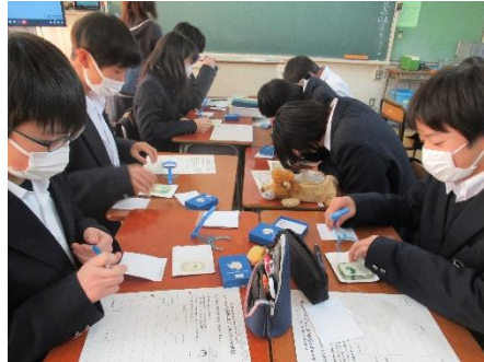
海洋教育プログラムです。南極にあるプランクトンをルーペで観察してスケッチし、その後は生物の分類分けに挑戦しました。