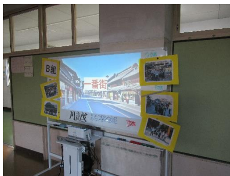
【総合】川越校外学習スライド