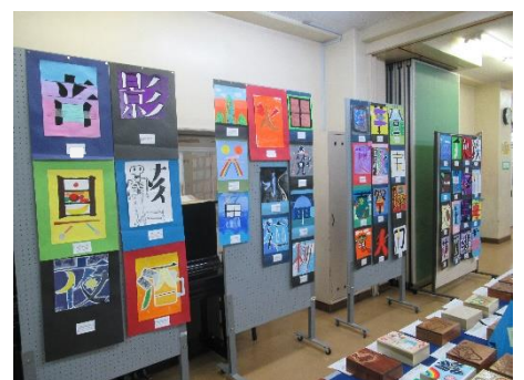
【美術】ユニークレタリング