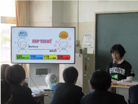
PEP講演会の様子です

3月9日（土）に、海洋教育プログラムとして「南極プランクトン」の観察実習を行いました。柳沢中では、一昨年度から海洋教育プログラムを実施しており、今年度は3年目となります。また、同日に「PEPトーク講演会」も行いました。普段の授業ではなかなか経験できない体験ができた、お話を聞けたりするのも柳沢中だからこそだと思います。今回の特別授業で学んだことをぜひ、今後の学習や生活に活かしていけると良いですね。