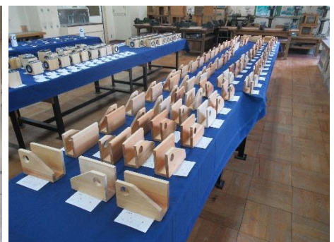
【技術】レターラック