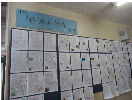
【理科】絶滅危惧種新聞