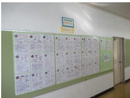
【英語】All About Me