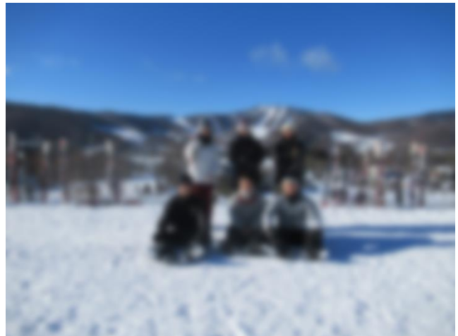
2日目に撮影したクラス写真。澄み渡る青空と雪景色の下、みんな良い笑顔をしていますね。 写真はまだまだたくさんありますが、またいつの日か見せたいと思います。