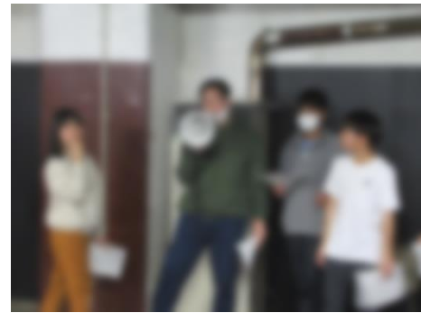
最後に「早口言葉選手権」をしました。お題がなかなか難しい…。

以上が前半戦です。まだまだ写真はたくさんあるので、 2・3日目の様子は次号以降紹介します！