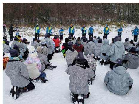
開校式の様子です。副校長先生やスキー学校の校長先生のお話に耳を傾けます。