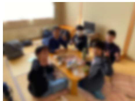
宿舎に到着し、保護者が用意してくださったお弁当を食べました。