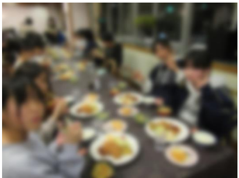
おいしい夕食を堪能しています。おかわりもたくさんしていました。