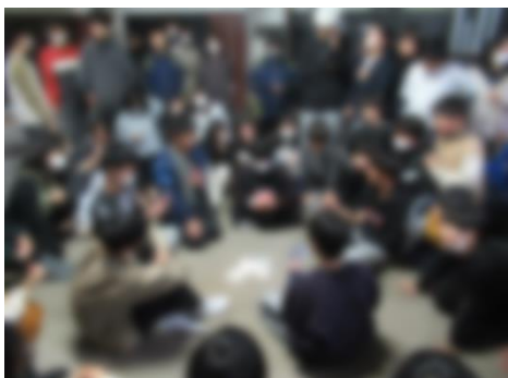
「ババ抜き最強・最弱王選手権」の様子です。みんなババ抜きに大盛り上がりでした。