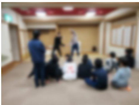
宿舎での自由時間。大広間を開放しました。手押し相撲やジェスチャーゲーム、カードゲームで遊んでいました。