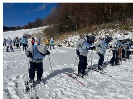
いよいよ実習開始！ 初心者にも分かりやすくインストラクターさんが教えてくれました。