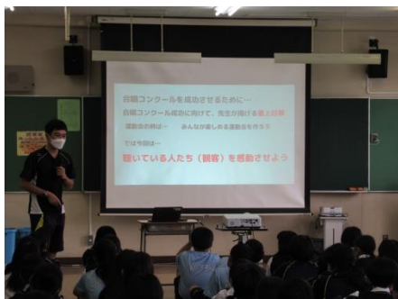
最上位目標の発表！