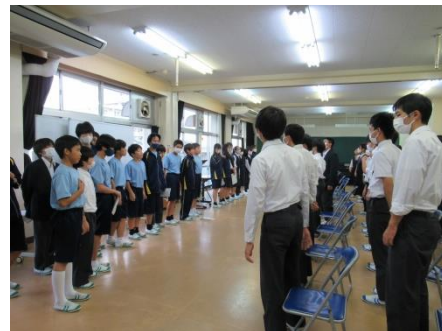
3年生の練習を見学しました。良い刺激になったのでは？ 3年生、ありがとう！