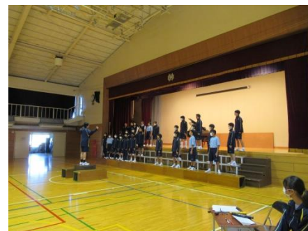
1度きりのリハーサル。広い体育館で歌う難しさがありましたね。