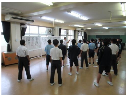
合唱練習が本格的に始まりました！