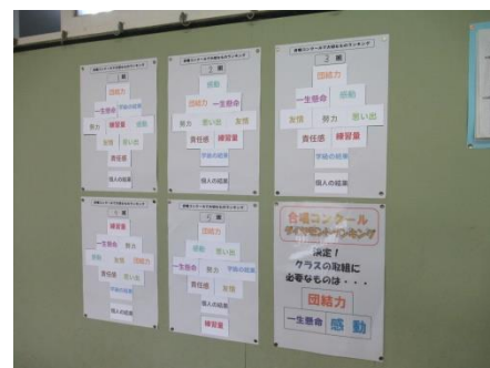
合唱コンクール ダイヤモンドランキング！ クラスで大切にしたいことは…？