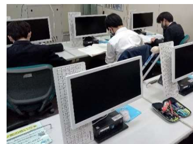
(理系男子の教え合いはハイレベル)