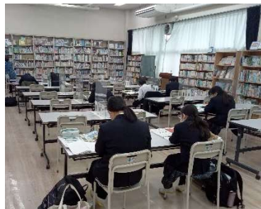
(黙々集中スペースとして推奨)