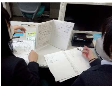
(教え合う事で双方の理解度向上に寄与)