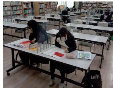
(受験生の集中力は素晴らしいです)