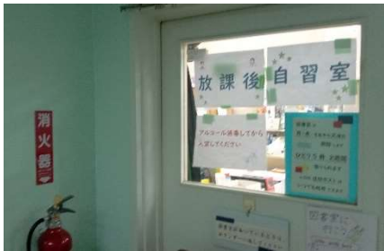
(放課後自習室会場は図書室とPCルーム)