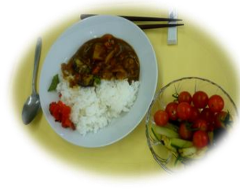
調理（カレー、サラダ）