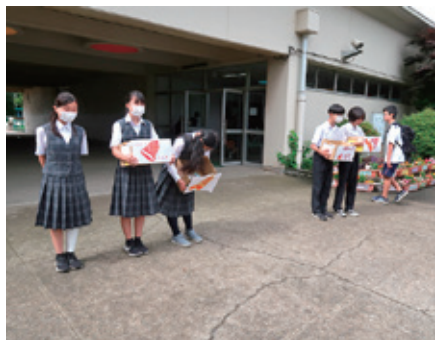
ベルマーク回収活動