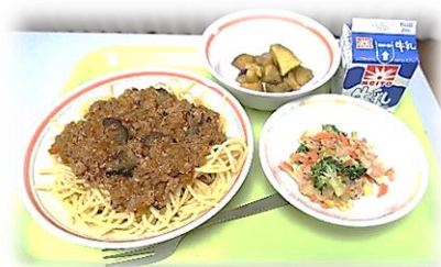
12月10日に採用されたメニュー

1年生は「西東京・地産地消プロジェクト」に取り組み、1学期の地域の農業についての体験、調べ学習をもとに、さらに、自分たちにできることとして、地元の農産物を使った給食メニューづくりに挑戦し、実際にそのメニューが2学期の全学年及び住吉小学校の給食に登場し、地域と学校の学びがつながる、生徒たちの主体的な素晴らしい実践となりました。