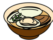
はまぐりのお吸い物