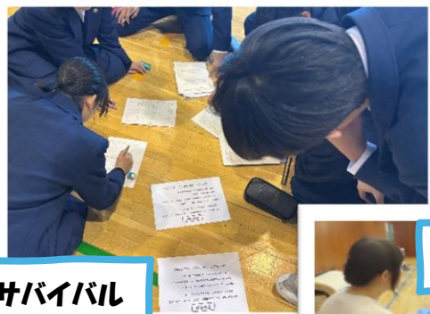
サバイバル ミッション