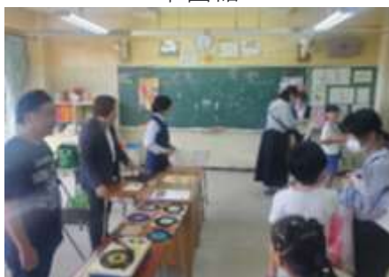
こども食堂・おもちゃくじ