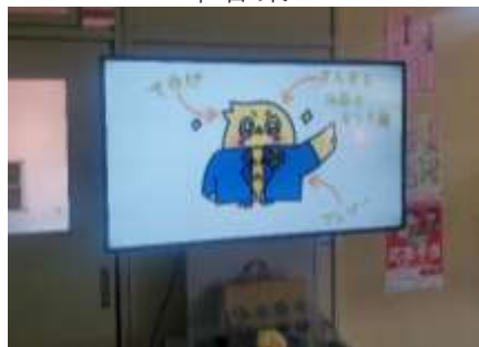
明ふくろうさんの紹介