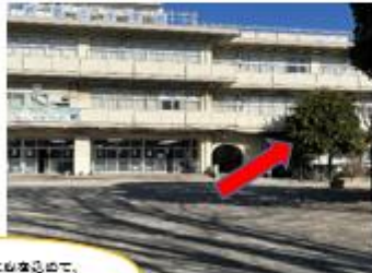
みんなのために必要なことで、校長先生が収穫しました。