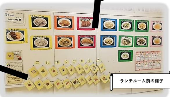
ランチルーム前の様子