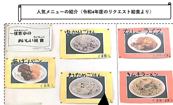
人気メニューの紹介（令和4年度のリクエスト給食より）