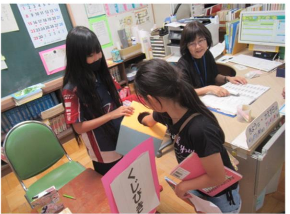
読書週間イベント(図書委員会によるくじびき)