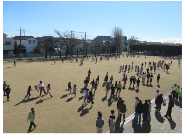
持久走(3学期の業間体育)