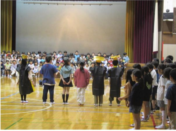
1年生を迎える会(上級生の出し物)