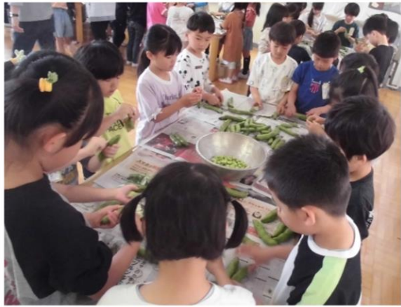
そらまめのさやむき(食育の取組)