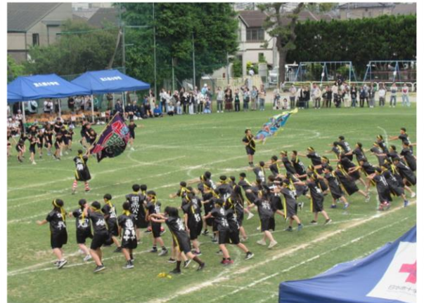
体育発表会のソーラン節