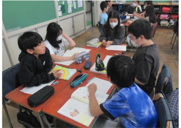
考えを深めるための話し合い