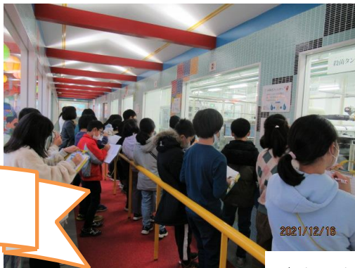
↑ クリクラ町田工場