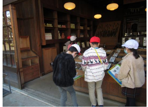
↑ 江戸東京たてもの園