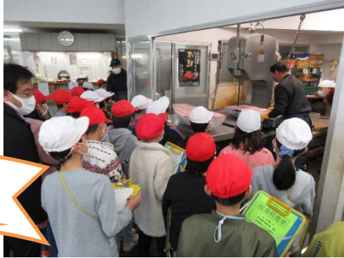
↑ 東久留米卸売市場