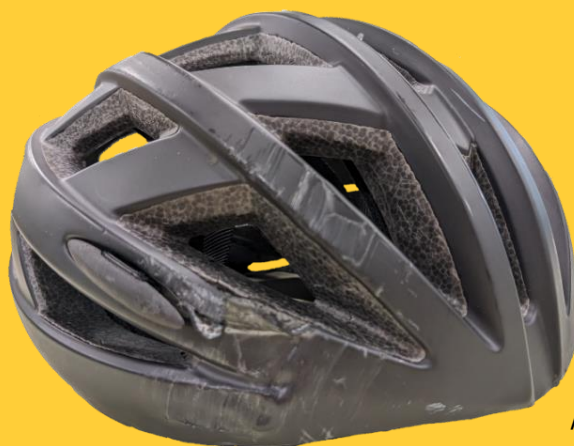
Aさんの命を守ったヘルメット

都立高校生のAさんは、自転車で下校中に転倒し、頭部を強く打ちましたが、ヘルメットを着用していたため、大きな怪我にはつながりませんでした。