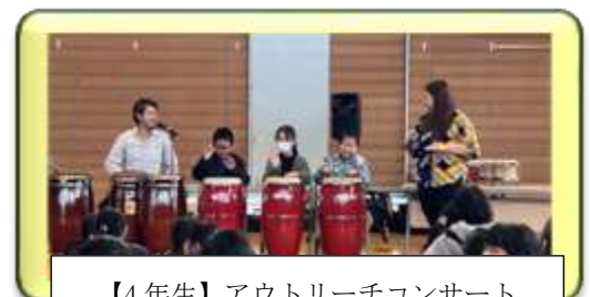
【4年生】アウトリーチコンサート ラテン楽器の演奏体験