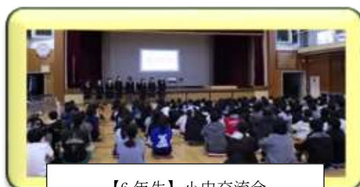
【6年生】小中交流会 四中の生徒さんをお迎えして