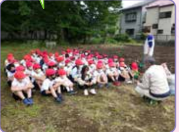
【2年生 なかよし農園での栽培】