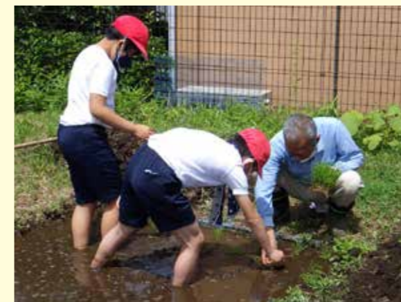
◀地域の方と直接触れ合う機会を設ける等、地域の中の学校を目指します。(学校の田んぼでの田植えの様子)