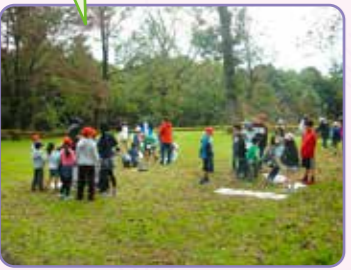
【フレンド班 上小フレンドパーク】

1年生にとって、新しい発見がいっぱいです。2年生のお兄さん、お姉さんにも手伝ってもらいました。