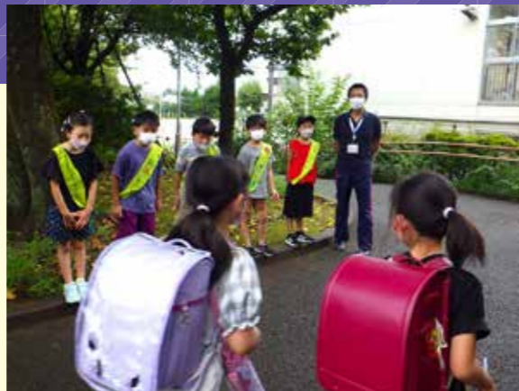
▲朝のあいさつを通して、コミュニケーションの第一歩が始まります。(年間を通したあいさつ運動の様子)

人や社会、自然とのかかわりを大切にしたい豊かなコミュニケーション能力を高める教育活動を推進します。