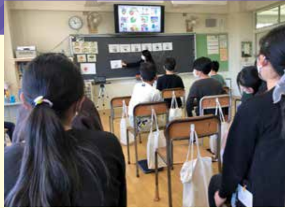
▲英語専科加配の利点を生かし、3~6年生の外国語及び外国語活動の充実を図っています。(外国語の授業の様子)

これからの社会を生き抜く子どもに対して、学習指導要領の内容を踏まえ、確かな学力を身に付けさせます。