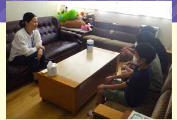
▲スクールカウンセラーと連携を図り、相談しやすい体制を整えています。(相談室の室内の様子)

子どもが安全に、安心して通うことができ、保護者が安心して通わせることができる学校づくりを推進します。