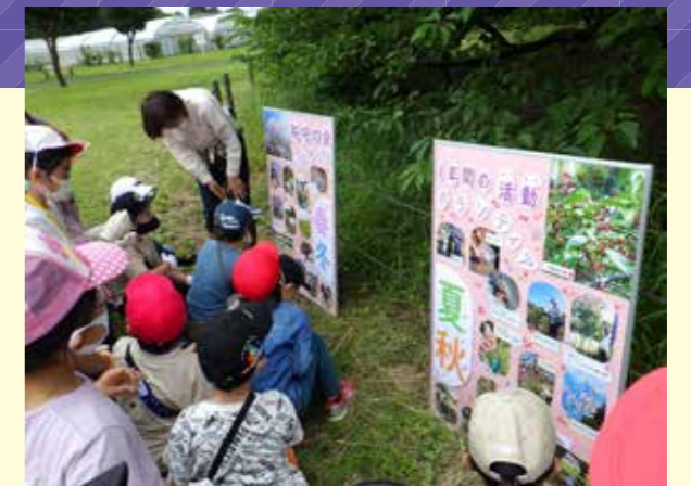
▲カリキュラム・マネジメントの視点から、地域の環境を効果的に活用した教育活動を行います。(小金井公園桜守の会の方との活動の様子)

地域とともにある学校を目指して、地域社会と連携を深め、地域に愛される学校づくりを推進します。