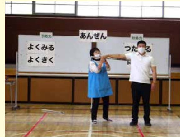
◀登下校時などに、不審者と遭遇した場合の対処法を学びます。(セーフティ教室の様子)