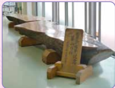
【玄関ロビーのベンチ】