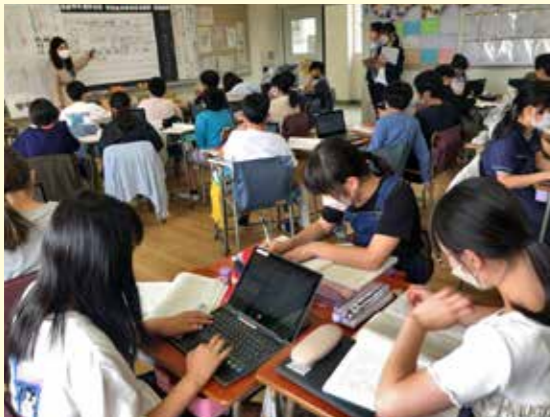
◀児童自ら学び方を選択し、自立した学習者になることを目指した授業に挑戦しています。(タブレット端末を文房具の一つとして活用した授業の様子)