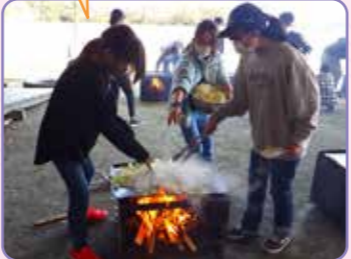
【6年生 赤城移動教室】