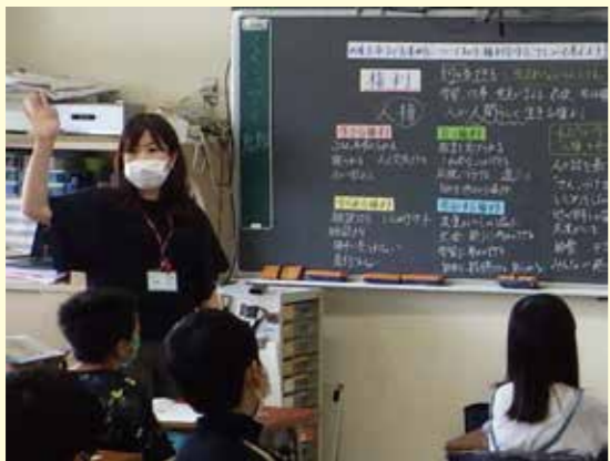
◀人権教育推進校として、相手呼びすてにせず「さん」を付けて呼ぶことを全校で取り組んでいます。(西東京市子ども条例と人権について考える学級活動の様子)