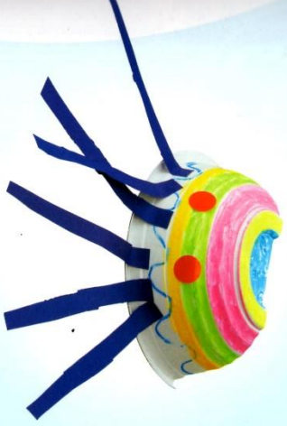
「ゆるゆるとうごくのでクラゲにしよう。」 (たかさ8cm)