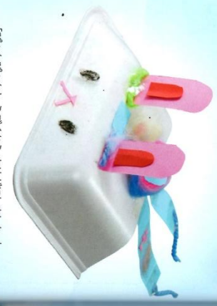
「おんぴおんとうごくからウサギにしました。」 (わた/たかさ8cm)