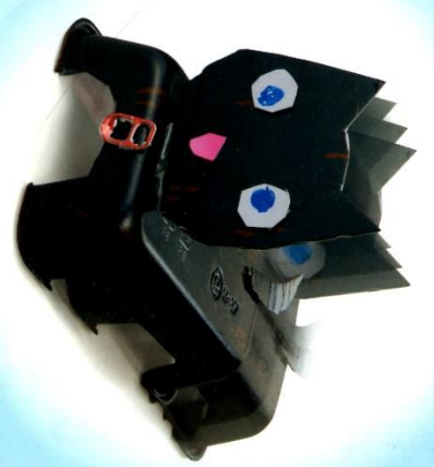
「アクリルボールをきってネコのあしにしよう。」 (たかさ16cm)