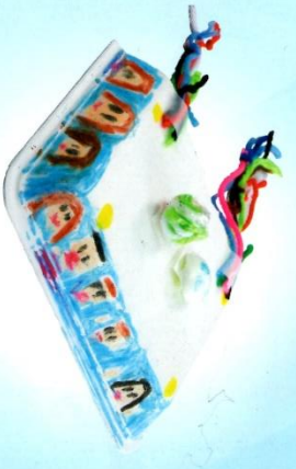
「ネットをすむからせんすいかにしよう。」 (けいこ/たかさ6cm)