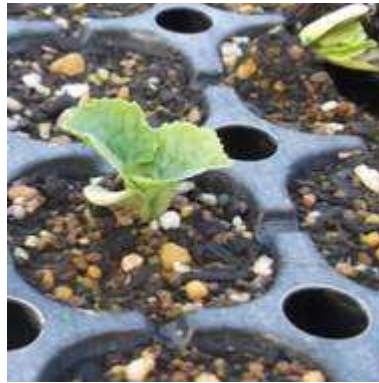
ツルレイシ(ゴーヤ)