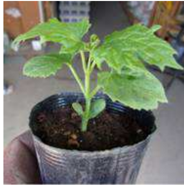
ツルレイシ(ゴーヤ)