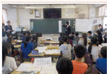
主体的・対話的で深い学びの実現を目指した授業