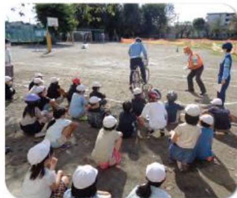
セーフティ教室「自転車教室」