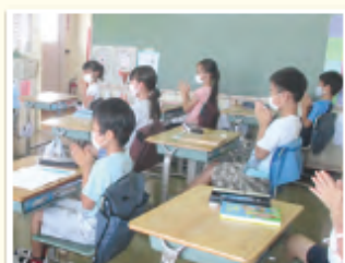
エンカウンター「こころあわせ」活動を行う様子