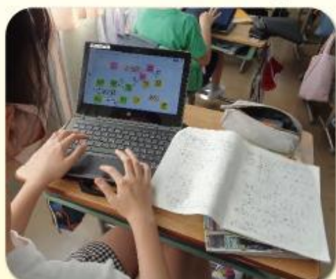
タブレットを活用した授業