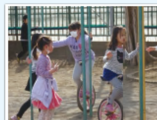
休み時間に大人気の一輪車