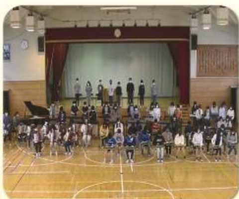
6年生を送る会 (ビデオで撮影・交流)