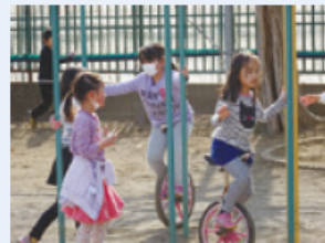
休み時間に大人気の一輪車