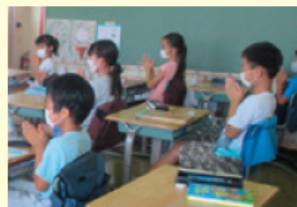
エンカウンター「こころあわせ」活動を行う様子