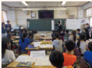
主体的・対話的で深い学びの実現を目指した授業