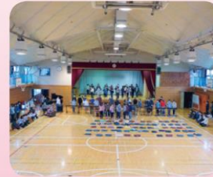
6年生を送る会 (ビデオで撮影・交流)