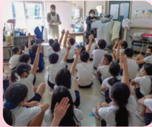
コロナについて学ぶ保健