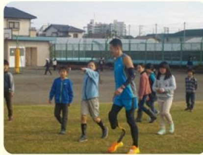
オリンピック・パラリンピック体験