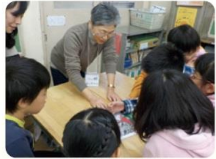
対話による美術鑑賞