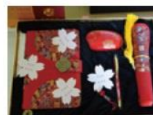
中国の学校が視察に来た時のお礼の品