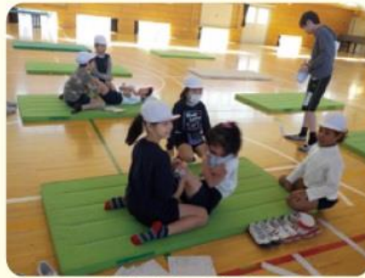
保谷オリンピック