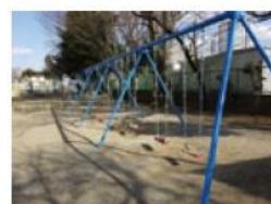
バランス感覚を養うブランコ