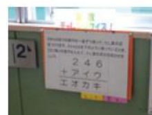
階段の踊り場に掲示してある算数の問題