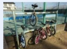
休み時間に大人気の自転車