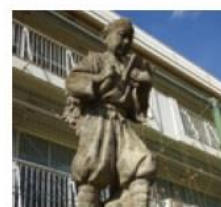
子どもたちを見守る学習の象徴「二宮尊徳像」