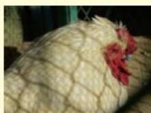
4年生が中心になって育てているにわとり