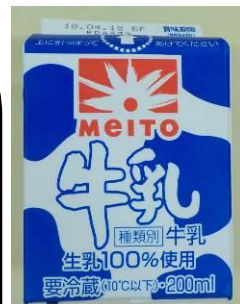
きゅうにゅう 牛乳