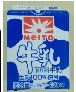
きゅうにゅう 牛乳

☆ みそ は新潟県 とうかまち うすいのうえん 十白町の白井農園 から届きました。