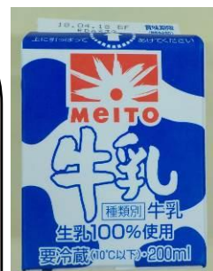
きゅうにゅう 牛乳