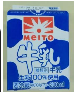
ぎゅうにゅう 牛乳