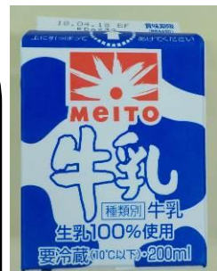
きゅうにゅう 牛乳