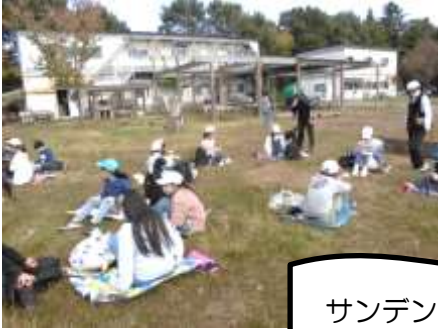
サンデンフォレスト