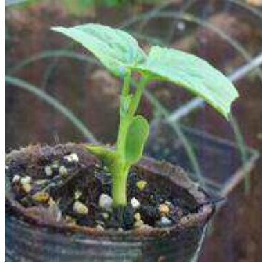
ツルレイシ(ゴーヤ)