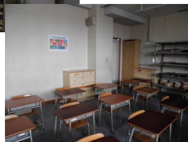
1年生、SDGsとの初めての出会い