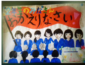
☆1年生からのメッセージ!