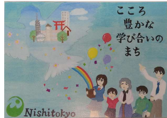
〇〇さんの描いたイメージイラスト

■「西東京市のまちづくりに向けた第三次総合計画」作成に当たり、西東京市市民憲章の目指すまちづくりのイメージイラストを〇〇(2-B)さんが描きました。