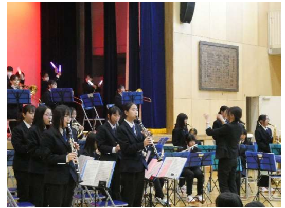
吹奏楽部によるお祭りのフィナーレ

■「第一回ひばり祭り」ボランティア参加 11月19日(日) 「秋まつり実行委員会」(育成会ひばり、中原小学校施設開放運営協議会、中原小学校父親の会、中原小学校PTA、ひばり児童センター)が主催で、秋まつりが中原小学校で行われました。この秋まつりには、準備から片付けまで、本校の生徒もボランティアで参加しました。まといれや、お絵かきコーナーなどの遊びのブースでお手伝いをし、小学生と一緒に楽しむことができました。大会実行委員の方々から、よく頑張っていたとお褒めのことばをいただきました。またフィナーレでは吹奏楽部が演奏し、第一回ひばり祭りを盛り上げました。