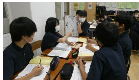
ひばりスタンダードで話し合い

「社会の中での人とのかかわり方や自分の役割について考える」をテーマに、1年生は「心が変われば、運命が変わる」（公正、公平、社会正義）、2年生は「『いいね』のために？」（遵法精神、公德心）、3年生は「好きな仕事か安定かなやんでいる」（勤労）、I・J学級1年生は「新しいプライド」（勤労）、2年生は「だれを先に乗せる？」（公正、公平、社会正義）3年生は「好きな仕事か安定かなやんでいる」（勤労）の教材で行いました。4校時は意見交換会を会議室で行いました。主に、学校運営協議会委員（コミュニティスクール）、保護者の方々など授業を参観いただいた皆様と教職員で行いました。どのクラスも「ひばりスタンダード」による話し合い活動が定着しており、自分の意見を積極的に発言し、また他の意見を聞くことで、自分の意見を深めている様子がたくさん見られました。特に3年生の好きな仕事か安定かは、話し合いによって自分の意見が最後に変わるなど、授業の1時間で生徒が多面的多角的に考えることができ、新たな気づきのある授業になっていたと評価をいただきました。