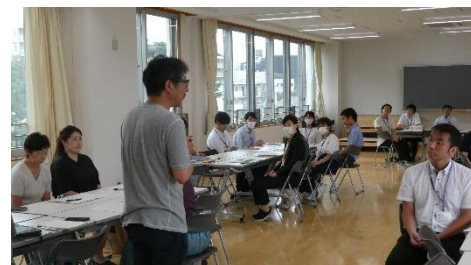
道徳授業のあとの意見交換会