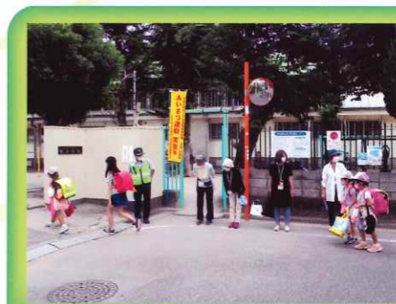
社会を明るくする運動