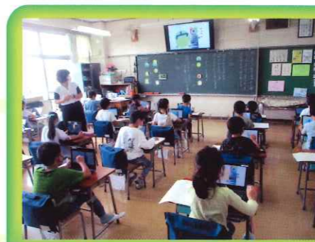
タブレットを活用した学習