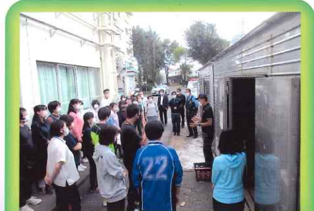
避難所運営協議会