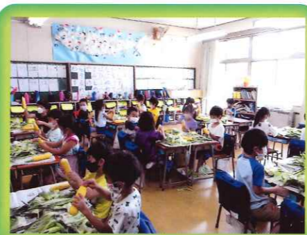
とうもろこしの皮むき体験