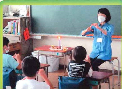
もぐらの会（語りの会）