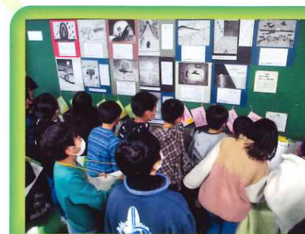
中学生との作品交流