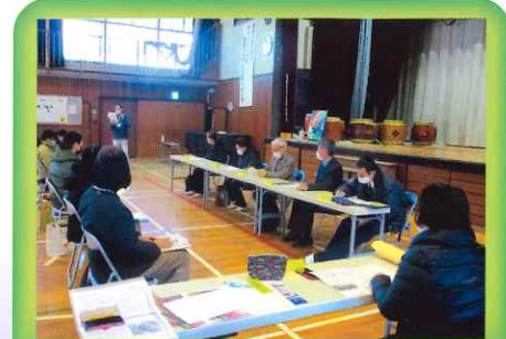
栄小地域安全連絡会の様子