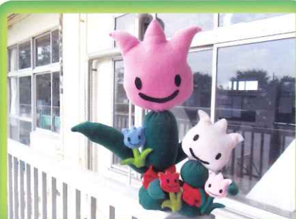
さかえちゃんマスコット

「育成会さかえ」と「わくわく栄」の他にも、栄小学校PTA、西東京市防犯協会、主任児童委員、民生委員・児童委員、学校施設開放運営協議会、避難所運営協議会、保護司、交通安全協会、田無警察署、西東京消防署、保谷苑など、たくさんの方々が本校の教育活動に対して協力してくださっています。