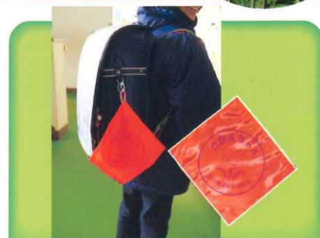
ランドセルにもさかえちゃんハンカチ