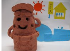
4年「おどるハニワッチ」