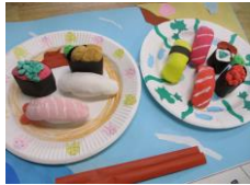
3年「回転しなくてごめんなさい！ だけど開店さかえずし」