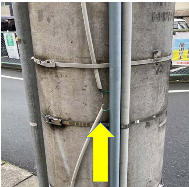
地図上 ★ 9 - 1

・富士町 1-8 の富士公園を左折した UR 沿いの歩道内電柱のワイヤーがプラスチックの留め金が外れて子供の目線の高さに飛び出していて危険。