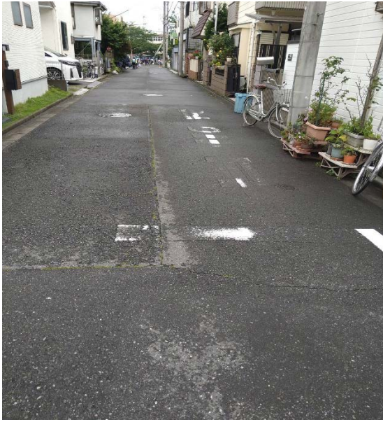
地図上 ★7 - 8