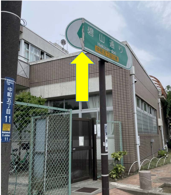
地図上 ★ 3 - 1

・碧山小北側の正門の職員出入口付近（住所:中町 5-11）にある道路標識の左側が折れ曲がっている。