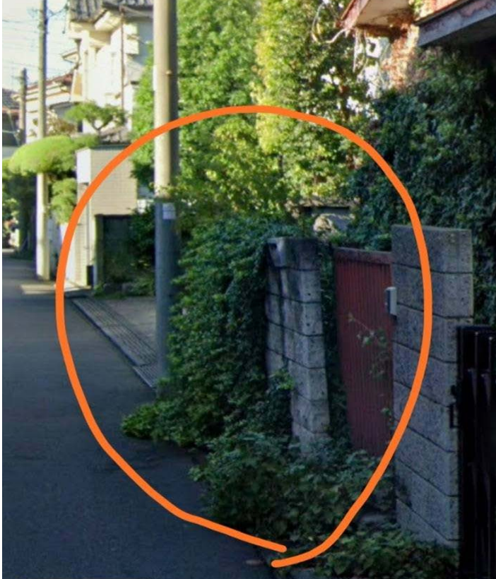
地図上 ★ 8 - 1

・1 班集合場所からまどかを通過して右折した後の直線の道沿いに、ブロック塀が傾いている家があり（中町 4-2-21 付近）植物も道路に伸びてきて塀が傾いており、倒壊の心配があるので怖い、気をつける必要があります。