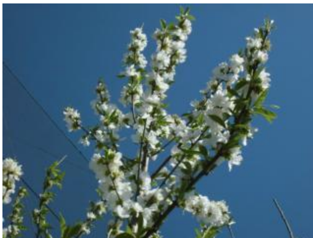
(1) ももです。(タイヤのちかくに5本あります。)