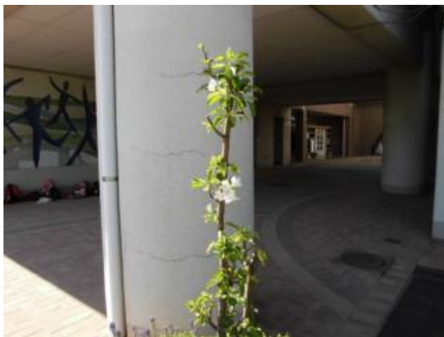
(3) ひめリンゴです。(ピロティのはしらのまえに1本あります。)