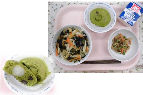
五目うどん ごまあえ 抹茶だんごむしパン 牛乳

ばばばあちゃんのお家のように、みんなでわいわい食べてみたくて給食で再現しました。